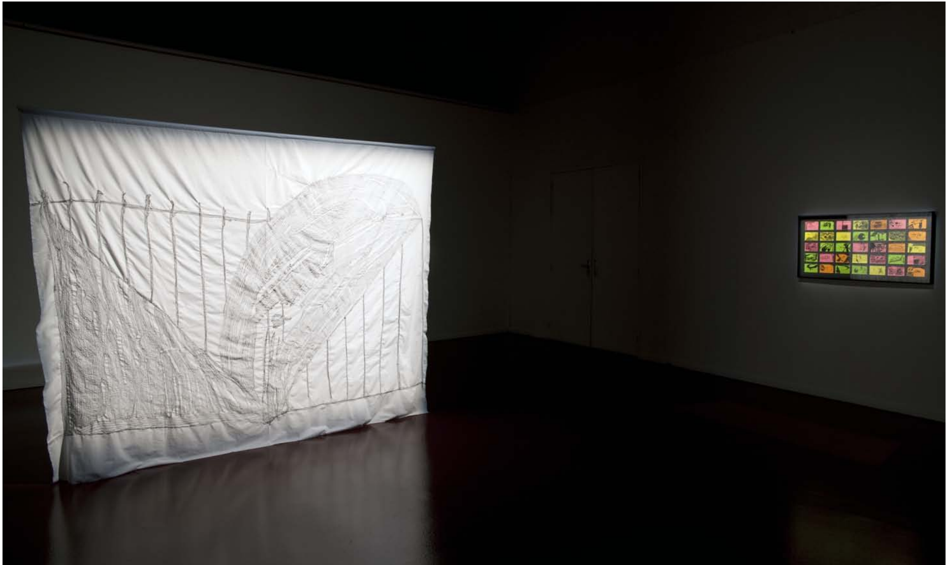
Grande Salle / Grosser Saal Vue de l'exposition le soir. Blick in die Ausstellung am Abend.