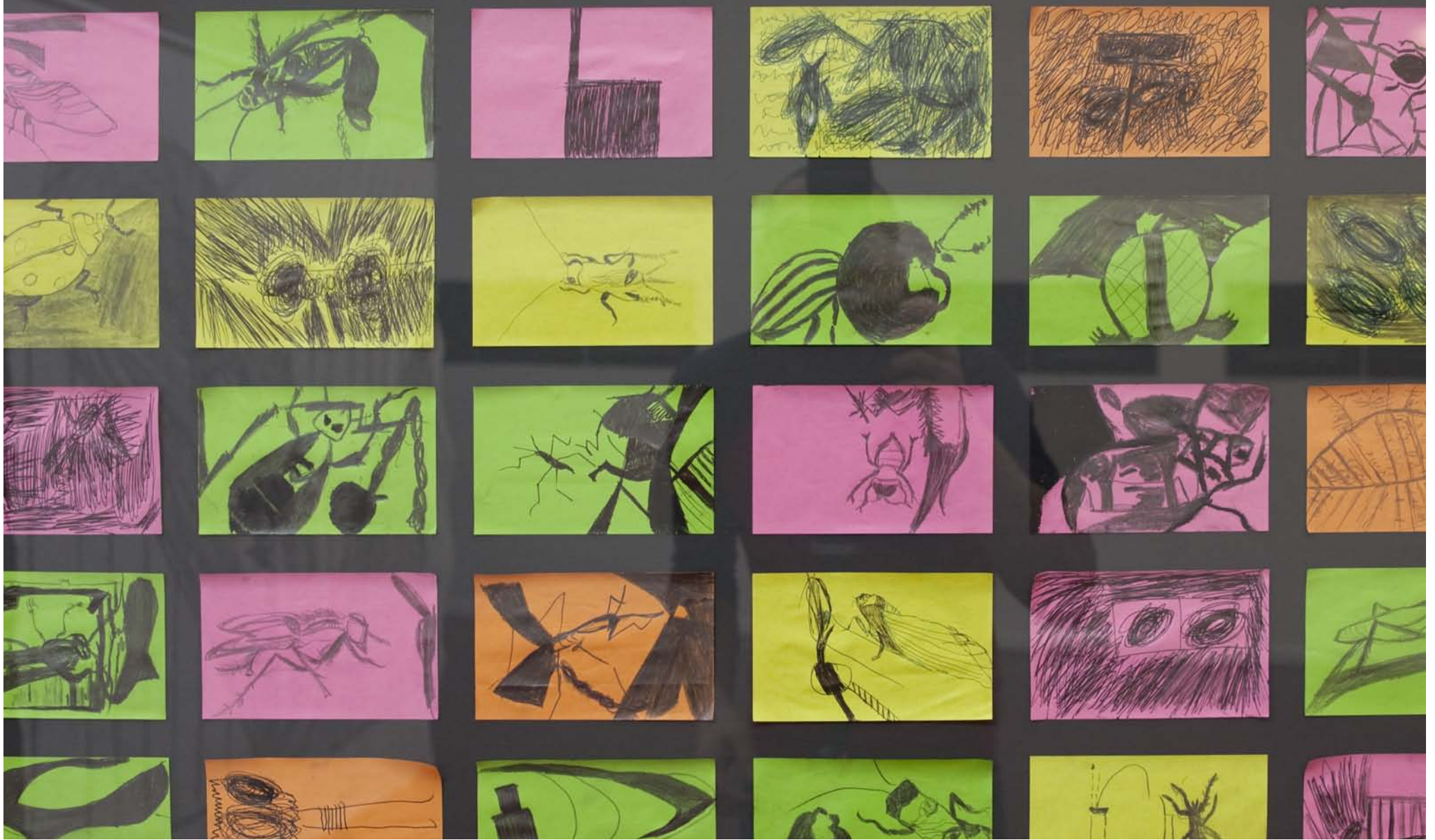
À droite/Rechts 35 Dessins d'insectes sur Post-it 112,5 cm x 57,5 cm - Détail 35 Zeichnungen von Insekten auf Post-it 112,5 cm x 57,5 cm- Ausschnitt